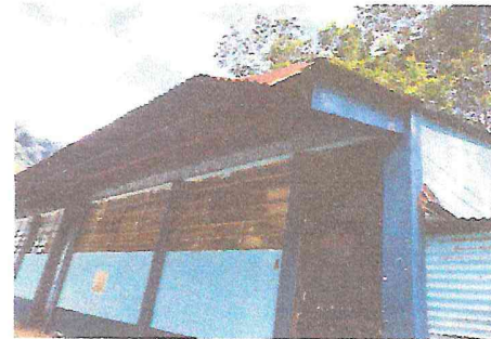
Foto 4: LA LÁMINA DE LA PARTE FRONTAL DE ESTE MÓDULO, SE ENCUENTRA DOBLADA Y ROTA DEBIDO A LOS FUERTES VIENTOS.