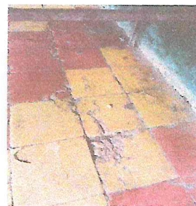
Foto 6: EN ESTA PARTE DEL CENTRO EDUCATIVO SE PRESENTAN DAÑOS COMO ESTE, EN DISTINTOS PUNTOS (CORREDOR, AULAS, DIRECCIÓN).

Observación: Si es necesario se pueden agregar hojas adicionales y actualizar el registro de fotos.