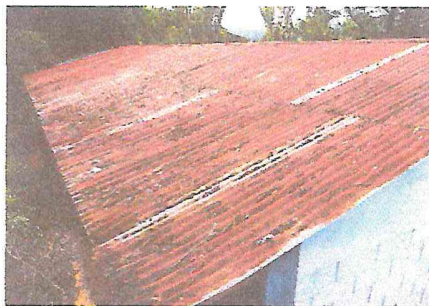
Foto 3: EL TECHO DE DICHO MÓDULO SE ENCUENTRA DETERIORADO, ESTO A CAUSA DE LA CANTIDAD DE TIEMPO QUE TIENE DESDE SU COLOCACION.