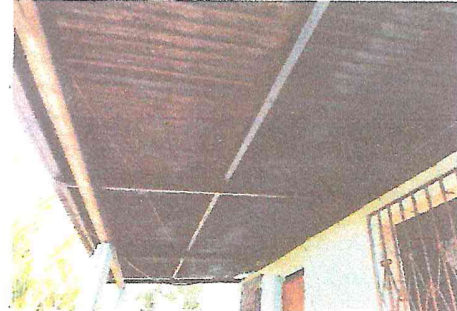
Foto 2: EL TECHO DEL CORREDOR DE LA COCINA, SE ENCUENTRA DETERIORADO POR EL OXIDO DEBIDO A LA CANTIDAD DE TIEMPO QUE TIENE DESDE SU COLOCACIÓN.