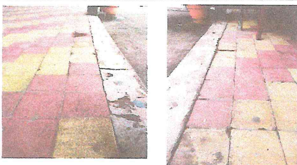
Foto 5: EN ESTAS FOTOGRAFÍAS SE PUEDE OBSERVAR EL DAÑO QUE PRESENTA EL PISO, DEBIDO A LA CANTIDAD DE TIEMPO QUE TIENE DESDE SU COLOCACION.